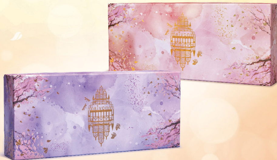
典藏系列—夢影紫雙層禮盒