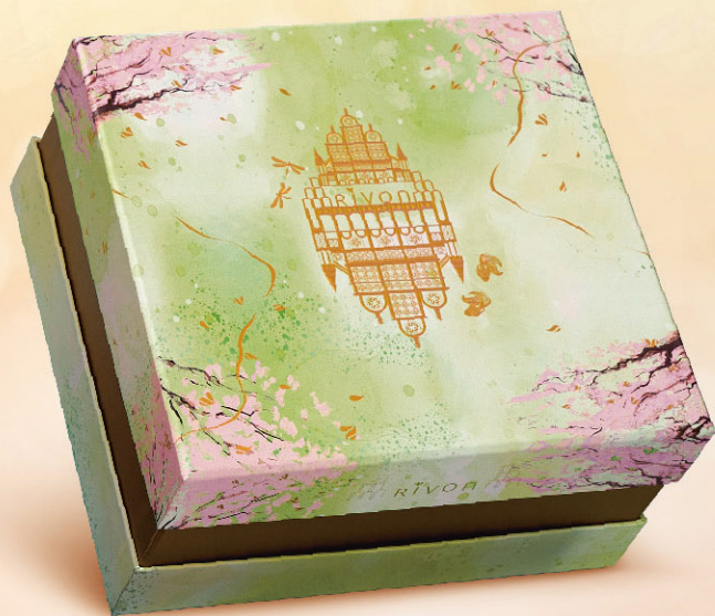
典藏系列—華獻珍愛雙層禮盒