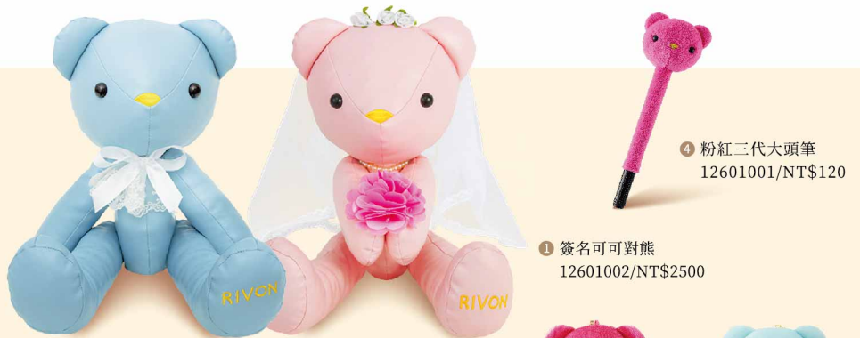
4 粉紅三代大頭筆 12601001/NT$120 1 簽名可可對熊 12601002/NT$2500