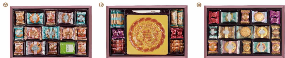
A 奶油起士、南瓜牛奶餅、覆盆莓花形餅、甜甜圈芝麻餅、特濃巧克力豆、鑽石檸檬餅、粉紅心情、杏巧圈餅、草莓懷特鬆餅、切達乳酪餅、心印小餅、巧克力豆餅、芝麻酥、薄荷檸檬茶包 B 撲克餅、米蘭鬆塔、巧鈕甜心糖、12兩大餅【相思麻糬(奶蛋素)/漢宮御點(葷)]、覆盆莓花形餅、奶油起士 C 巧鈕甜心糖、綠茶菓子餅、芝麻酥、愛情花語餅、特濃巧克力豆、搵茶脆餅、開心for you 餅、莓果塔魯多、巧莓熊餅、切達乳酪餅、巧克力豆餅、奶油起士、藍莓螺旋餅、心印小餅

雋永璀璨-紅寶石 A+C(西式) 12105014 / NT$660 A+B(相思) 12105015 / NT$690 A+B(漢宮) 12105016 / NT$710