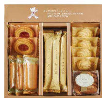
下層 莓果塔魯多、普蘭三明治(葷，含酒)、法式奶油雪茄捲(香草奶油)、法式曲奇餅(奶油原味)、檸檬鑽石餅