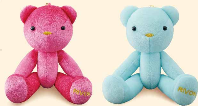
2 閃耀洛可可熊 12601005/NT$290 3 天晴洛可可熊 12601004/NT$290