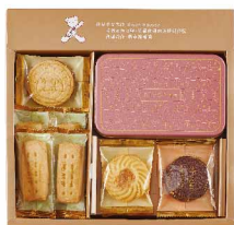
上層 開心for you餅、英式奶油餅、法式曲奇餅小鐵盒(芝麻)、焦糖俚娜、榛果巧克力餅