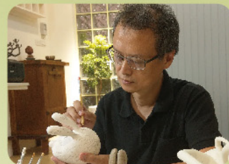
作者 / 卓銘順

出生於鶯歌尖山，1995年在鶯歌開立工作室， 以手工量產各式生活陶器聞名，作品多會融入自然生態元素，近年多以互動式創作為主，曾獲得 「第二屆聖尼古拉斯當代馬賽克雙年展」第二名、 多屆「臺灣金壺獎」金牌與銅牌。其作品兼具美感 及質感，獨具特色造形有深層的思維意涵。