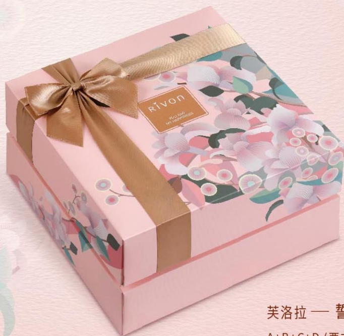
芙洛拉 —— 誓言 (2+2層)

A+B+C+D (西式) 12104024 • NT$750 A+B+C+E (相思) 12104025 • NT$780 A+B+C+E (漢宮) 12104026 • NT$820