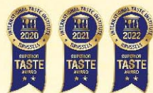
榮獲國際食品大獎「風味絕佳大獎」

使用頂級天然發酵奶油製作，濃郁酥鬆綿密化口，添加高級沙漠湖鹽，讓風味更顯層次，以最美味的糕點，傳遞最誠摯的情感。