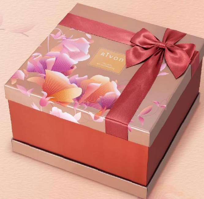
芙洛拉 —— 永愛 (2+2層)

A+B+C+D (西式) 12105054 • NT$990 A+B+C+E (相思) 12105055 • NT$1020 A+B+C+E (漢宮) 12105056 • NT$1060