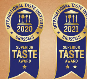
榮獲國際食品米其林 「風味絕佳大獎」